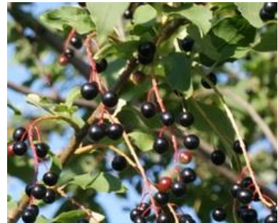
ломбо (bird cherry)