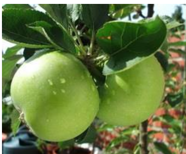
олману (apple tree)